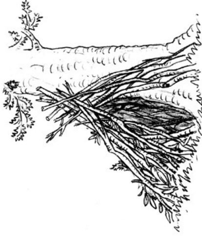
Illustration: U. Suckow

Baut euch eine Höhle im Wald aus Ästen und Laub. Hier könnt ihr euch fühlen wie der Igel in seinem Nest. Vorher solltet ihr jedoch den Förster um Erlaubnis bitten.