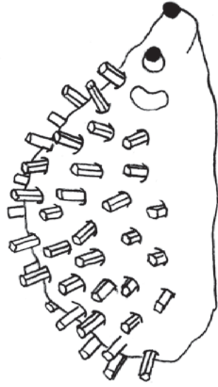
Illustration: U. Suckow

Forme aus Knete einen Igelkörper und stecke Streichhölzer als Stacheln hinein.